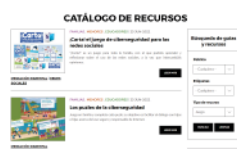
Tipo de recurso: Juego