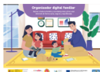
Organizador digital familiar