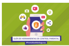
Herramientas de control parental