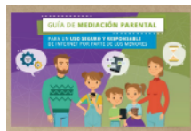
Guía de mediación parental

https://www.is4k.es → De utilidad → Catálogo de recursos: